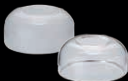
ガラスグローブ G35F (フロスト) 12,000円(税別)