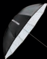
アンブレラ ホワイト 1000φ 10本骨(収納ケース付) 13,000円(税別)