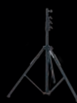
ライトスタンド LST-4 高さ 2400mm 重さ 1.25kg 15,000円(税別)