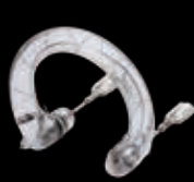
フラッシュチューブ QC-600GS 22,000円(税別)