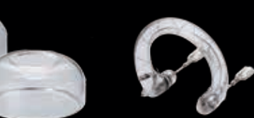
ガラスグローブ G35C (クリア) 12,000円(税別)