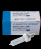
ハロゲンランプ 100V 200W 3,000円(税別)