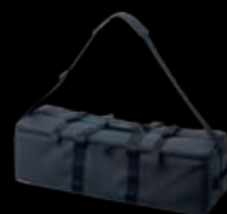
ダブルデッキバッグ 収納目安:モノスター2灯 スタンド2本、アンブレラ2本 18,000円(税別)